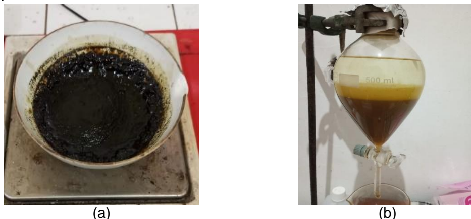
Gambar 1. Hasil ekstraksi daun jengkol ( Pithecellobium lobatum ) (a); Fraksinasi ekstrak etanol daun jengkol ( Pithecellobium lobatum ) dengan pelarut n-heksan (b)

& Wirman, 2018). Fraksi cair diuapkan hingga bobot tetap dan diperoleh rendemen 16,5%.