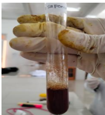
Gambar 4. Hasil uji saponin ekstrak daun kersen ( Muntingia calabura L.)

Pada uji saponin, didapatkan hasil positif yang ditandai dengan timbulnya busa dengan tinggi 1 cm dalam waktu 30 menit. Menurut Baud (2014), reaksi yang terbentuk berupa timbulnya buih atau busa sebagai akibat dari adanya reaksi komposisi kimia yang terkandung dalam sampel. Adanya gugus hidroksil dan karbon sebagai bagian dari struktur penyusun saponin organik memungkinkan senyawa ini memiliki sifat larut dalam air dan dapat berbuih. Berikut merupakan hasil uji saponin ekstrak daun kersen ( Muntingia calabura L.) yang dapat dilihat pada gambar 4.