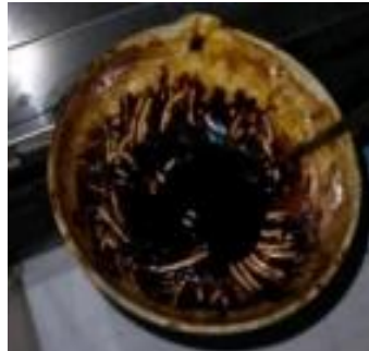
Gambar 1. Hasil ekstrak daun kersen ( Muntingia calabura L. ) dengan pelarut etanol 96%

dkk, 2014). Setelah proses penguapan didapatkan hasil ekstrak yang kental seperti pasta, berwarna hijau kehitaman dan berbau khas.