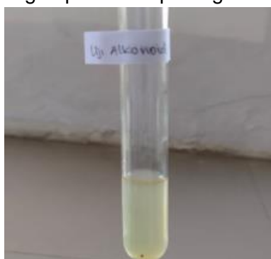
Gambar 3. Hasil uji alkaloid ekstrak daun kersen ( Muntingia calabura L.)

Pada uji alkaloid dalam penelitian ini didapatkan hasil positif yang ditandai dengan adanya perubahan warna dan terbentuknya endapan setelah penambahan reagen mayer. Uji alkaloid diperoleh hasil yang positif dengan terbentuknya endapan dari penggantian ligan. Atom nitrogen yang mempunyai pasangan elektron bebas pada alkaloid mengganti ion-ion dalam pereaksi Mayer. Menurut Nofitarini (2010), prinsip dari uji alkaloid adalah reaksi pengendapan yang disebabkan adanya pergantian ligan pereaksi mayer yang mengandung kalium iodida dan merkuri klorida sehingga dari reaksi tersebut menghasilkan Kalium-Alkaloid yang berupa endapan berwarna putih. Berikut merupakan hasil uji alkaloid ekstrak daun kersen ( Muntingia calabura L.) yang dapat dilihat pada gambar 3.